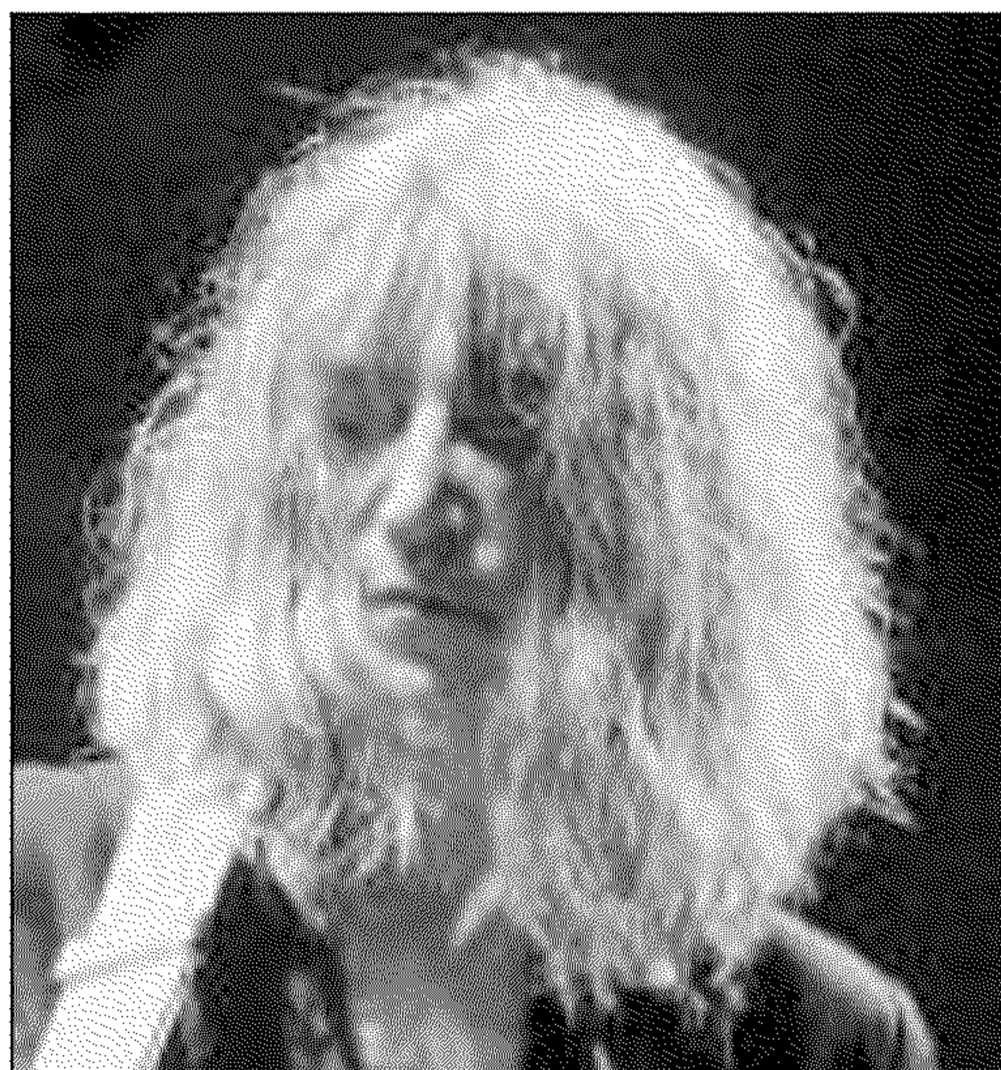
La cantante e poetessa Patti Smith