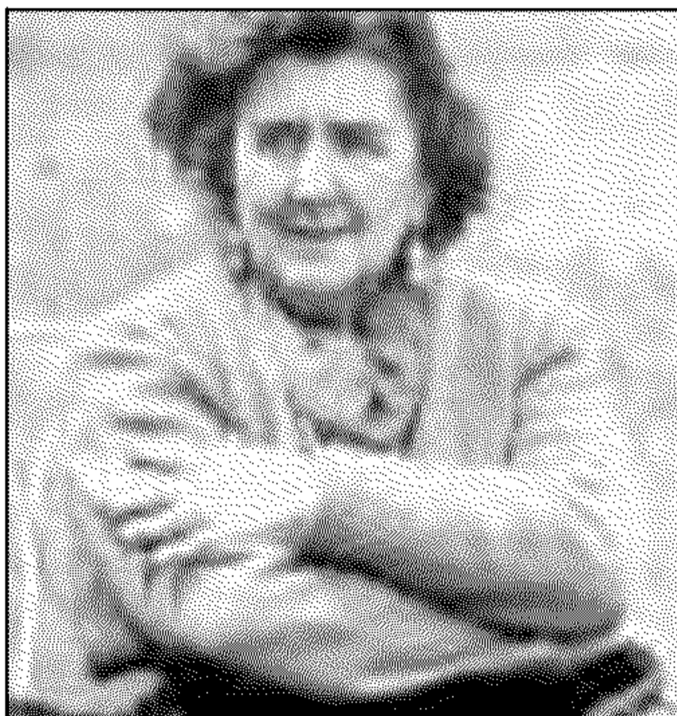
La poetessa Alda Merini